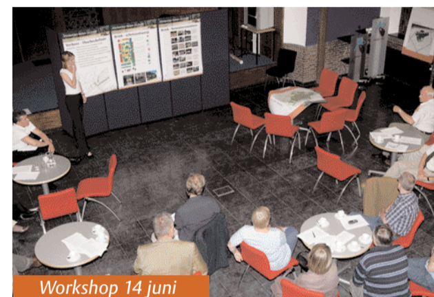
Workshop 14 juni

aan de wensen van de omwonenden en zijn de wijzigingen overgenomen en opgenomen in de nieuwe gebiedsvisie.