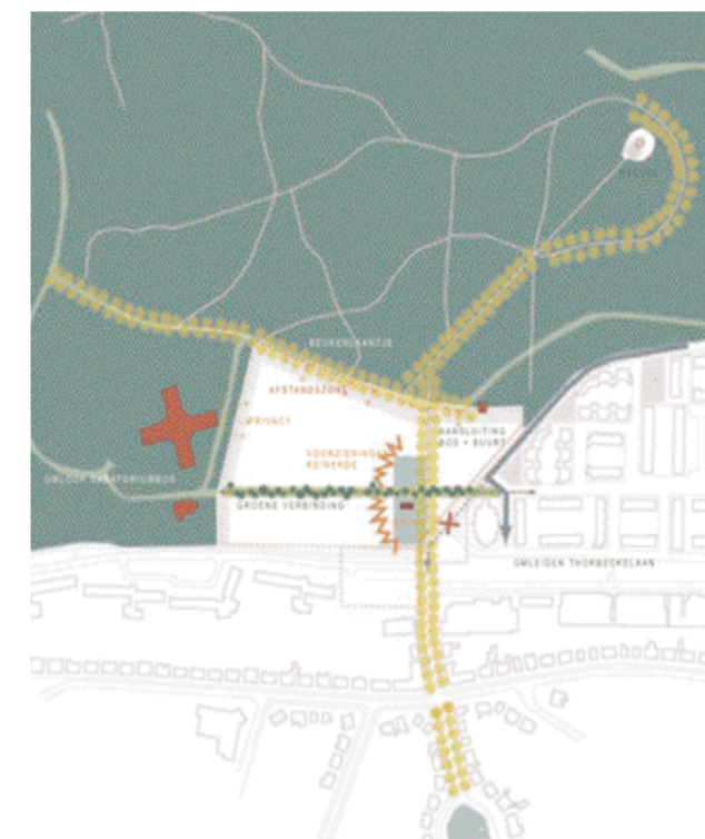
Voorstel voor buurtschap

De gemeente Zeist vindt het van groot belang dat de ruimtelijke kwaliteit van het Sanatoriumterrein niet achteruit gaat door de bouw van de buurtschap. Om dit te kunnen beoordelen en controleren, is de ontwikkelaar van de buurtschap verplicht een paar wettelijke onderzoeken uit te voeren.